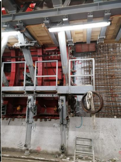
Abbildung 8: Betonage mit hydraulischem Schalwagen

Abschließend kamen wir nochmals zurück ins Baubüro, wo wir uns nochmals gestärkt haben und ein schönes Gruppenbild schießen durften. 😊 Anschließend endete unsere Tunnelexkursion und wir machten uns gegen Nachmittag wieder auf den Heimweg.