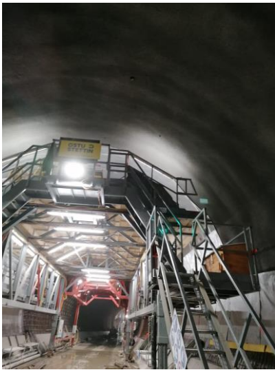
Abbildung 7: Bewehrungswagen

Anschließend folgte etwa 100 m weiter hinten der Einbau der Tunnelabdichtung und der Bewehrung im Gewölbe, bevor direkt im Anschluss die Betonage des Gewölbequerschnitts erfolgt. Für den Betoneinbau wird ein hydraulisch ausgerüsteter Gewölbeschalwagen verwendet, dem zur Betonnachbehandlung 3 Nachbehandlungswagen folgen.