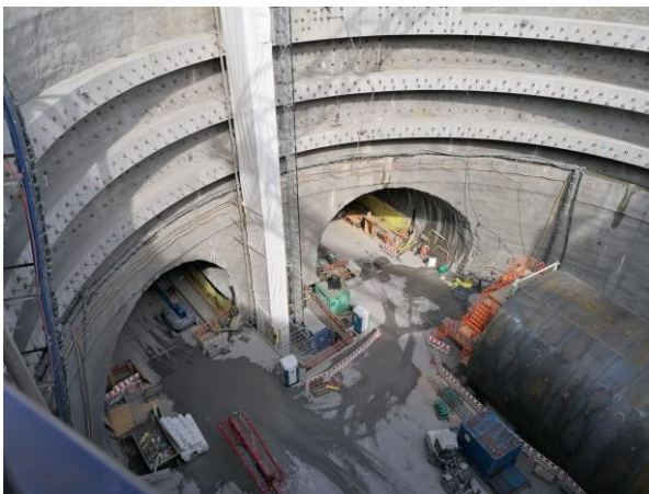
Abbildung 2: Haupttunnelzugang während der Bauzeit

Wie beschrieben sind wir nach einer Sicherheitseinweisung zuerst zum dem wichtigsten Zugangspunkt während der Bauphase aufgebrochen, dem Schacht Zugang Ost. Dort fuhren wir mit einem Aufzug in den 40 m tiefen Tunnelzugang.