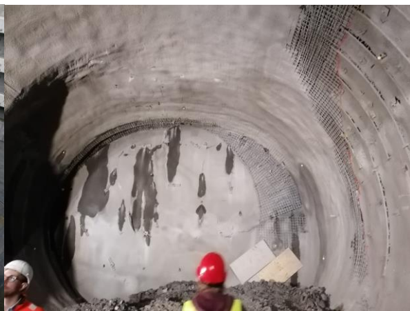
Abbildung 3: Ortsbrust

Hier konnten wir im Tunnel die Sicherung der Ortsbrust mittels Spritzbeton besichtigen.