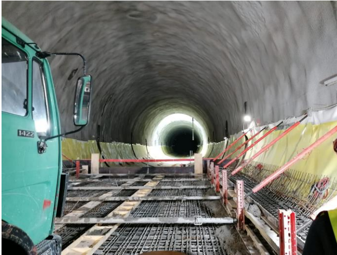
Abbildung 5: Bewehrung der Sohle im Innenausbau

Auf der Gegenseite erfolgte zeitgleich bereits der Ausbau der Innenschalen in den Bahnsteigröhren. Hier sahen wir den Einbau der Abdichtung und das Betonieren des Sohlbereichs des Maulquerschnittes als Vorarbeiten für die spätere Gleishöhe.