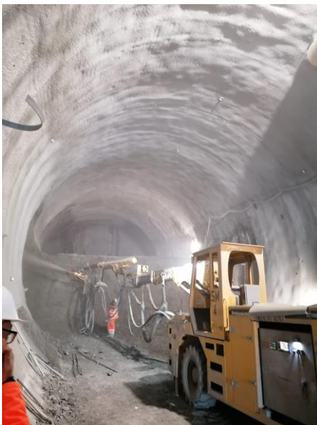
Abbildung 4: Spritzbetonsicherung der Strosse/Sohle

Hier konnten wir im Tunnel die Sicherung der Ortsbrust mittels Spritzbeton besichtigen.