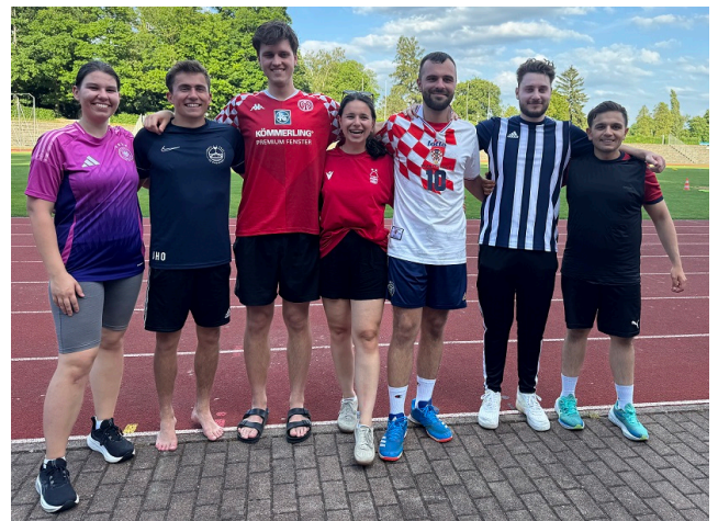
WR-Team "Wirtschaft in Bewegung"

Kurz darauf, am 23. Juni, fand im Bodenseestadion das sportlich-kreative Event „Wirtschaft in Bewegung“ statt. Ein Fußballturnier, eine Spaßolympiade und ein Glücksrad sorgten für Stimmung, während der Erlös aus Kuchen- und Getränkeverkauf der Arche-Kindertagesstätte zugute kam.