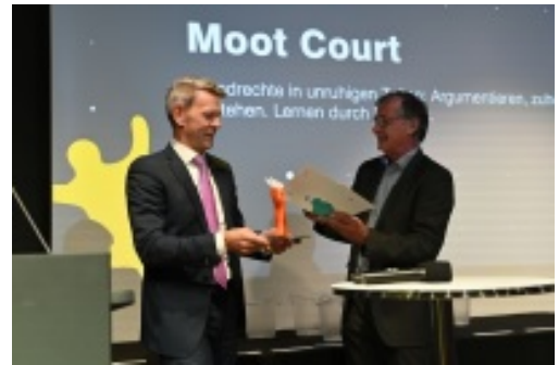
Lehrpreisvergabe Blended Learning 2025

https://www.htwg-konstanz.de/aktuelles/news/starkes-jahr-an-der-htwg-konstanz-hochschule-wuerdigt-spitzenleistungen