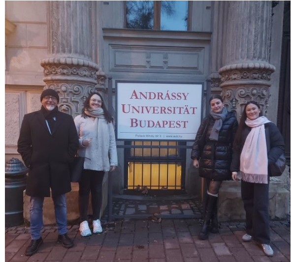
Auslandssemester der HTWG LL.M.-Studierenden bei der "Andrassy Universität" in Budapest

Auch das Jahr 2025 war geprägt von zahlreichen Auslandsaktivitäten unserer Studierenden. Neben unserer finnischen Partnerhochschule Vaasa University of Applied Sciences standen vor allem das "Dundalk Institute of Technology" in Irland und die "Andrassy Universität" in Budapest, Ungarn, hoch im Kurs. Hinzu kamen freemover „all over the world“, so dass wir mittlerweile an die Mobilität der Vor-Covid-Jahre anknüpfen.