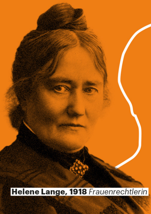
Helene Lange, 1918 Frauenrechtlerin