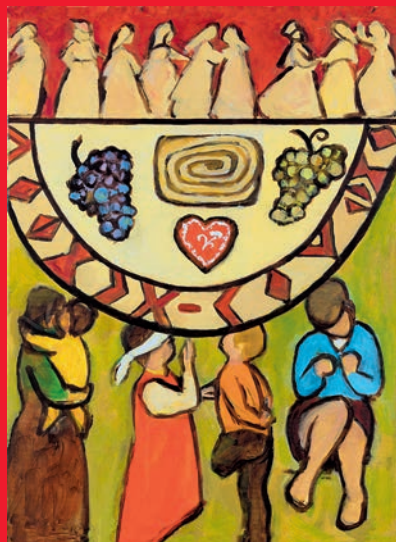
„Come – Everything is ready“, Rezka Arnus © Weltgebetstag der Frauen – Deutsches Komitee e.V.