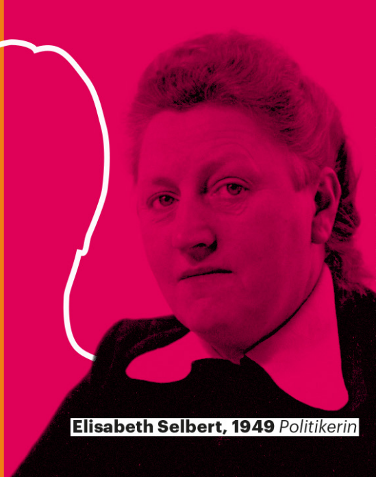
Elisabeth Selbert, 1949 Politikerin