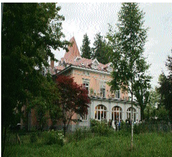
Seminar- und Tagungszentrum „Villa Rheinburg“

“Man bekommt hier etwas, das eben nicht zu kaufen ist“, sagte vor kurzem ein Absolvent und umriss damit treffend, was wir Ihnen in Konstanz anbieten wollen.